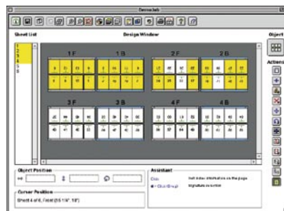
Раскладка спуска полос по тетрадам в пакете DynaStrip