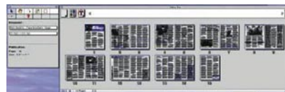
Исходные полосы в DK&A Inposition. Версия для Mac представляет собой отдельную программу, которая может принимать для спуска полос файлы, произведенные различными приложениями

Независимый интерпретатор PostScript и семейство одноименных продуктов, наиболее известный из которых JAWS PDF Creator. Приобретен компанией Global Graphics, купившей также и Harlequin. На момент написания статьи компания готовила к выпуску новый продукт — самостоятельное средство для ограниченного редактирования PDF-файлов JAWS PDF Editor 1.0 ( www.globalgraphics.com ).