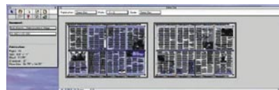
Готовый спуск полос в DK&A Inposition для Mac