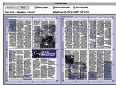
Предварительный просмотр спуска полос в DK&A Inposition для QuarkXPress